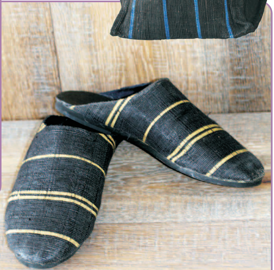
N° 14123 Babouches