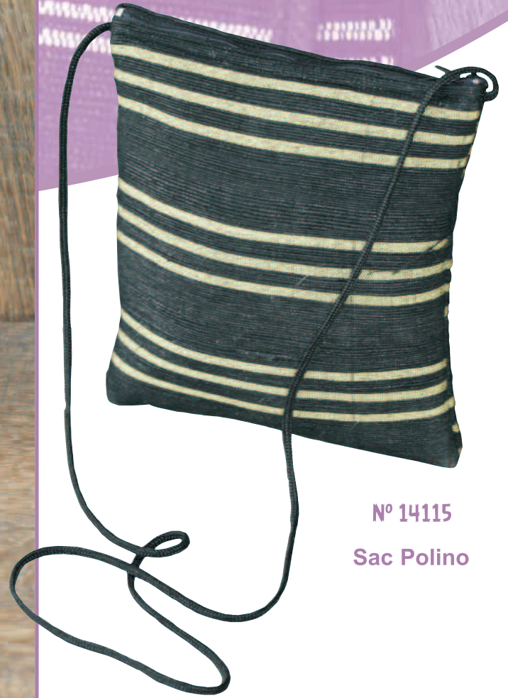
N° 14115 Sac Polino