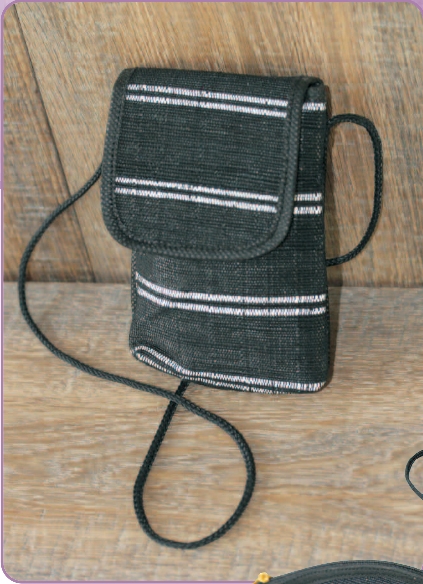
N° 14114 Étui portable