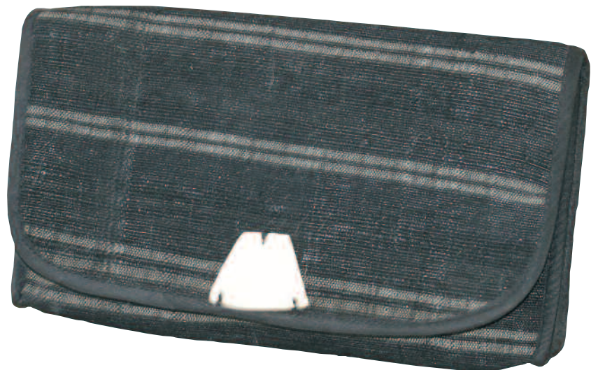
N° 14105 Pochette de soirée