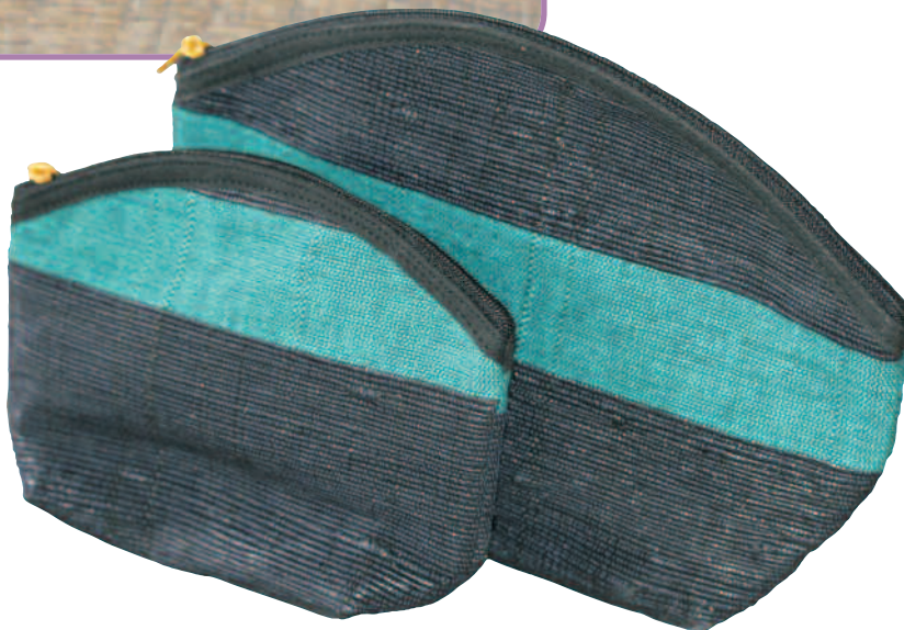
N° 14116 Trousse de maquillage petit