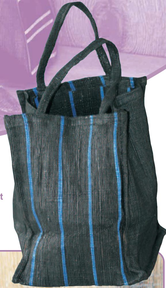
N° 14122 Sac cabas petit