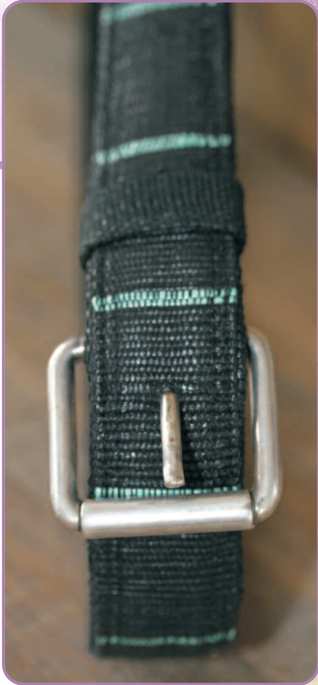
N° 14121 Ceinture