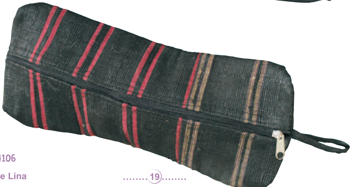
N° 14106 Trousse Lina